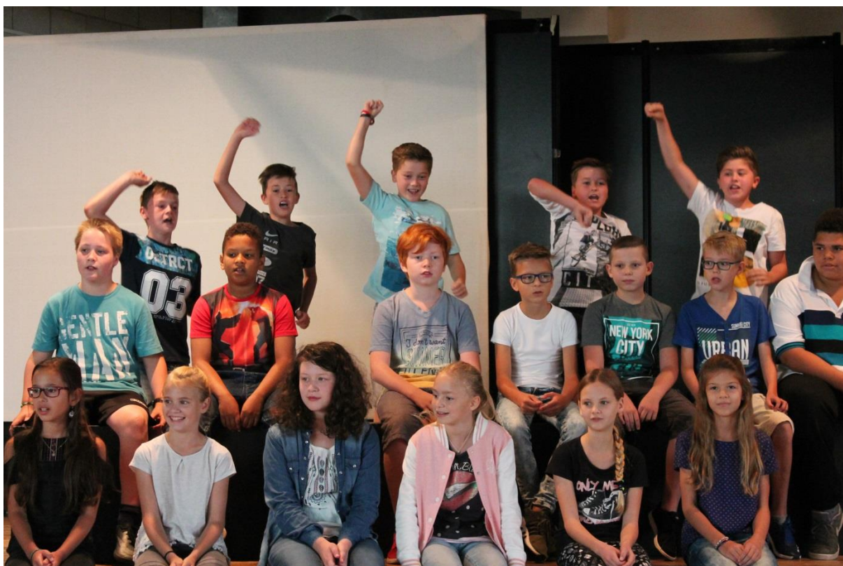
Neue Fünftklässler werden von IGS Kastellaun feierlich begrüßt

Die IGS Kastellaun begrüßt die neuen Schülerinnen und Schüler mit einer beeindruckenden Willkommensfeier